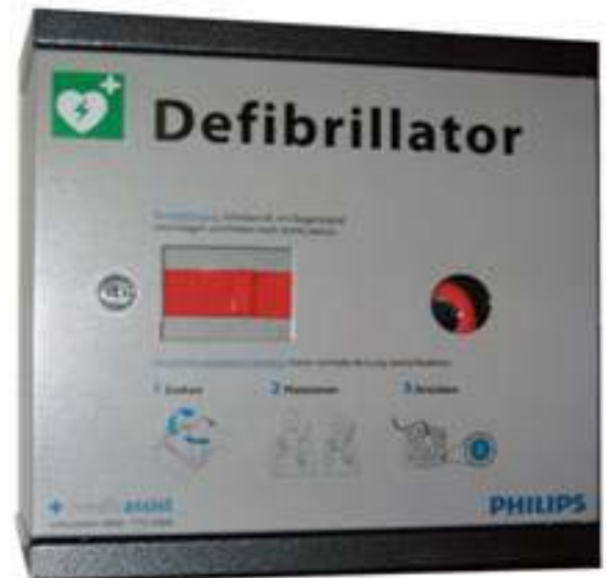
„Safebox Tennis“ © medicassist - Patent Pending

gelmäßigen Selbsttests, durch ein Sichtfenster abzulesen. Ein ständiges Öffnen der Safebox zu Kontrollzwecken entfällt somit.