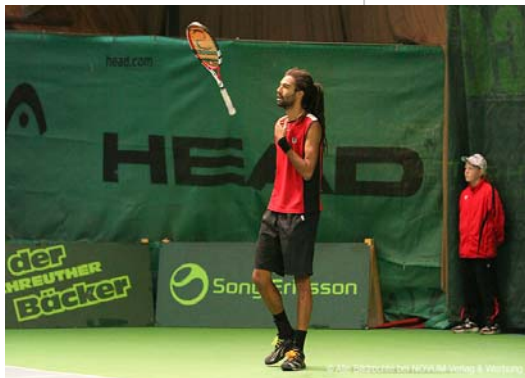
Musste sich im Finale geschlagen geben: Dustin Brown